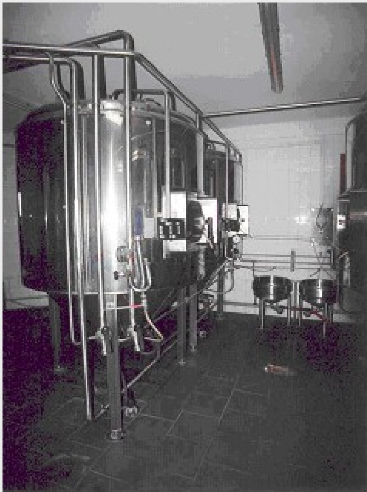
ZKTs und Hefewannen