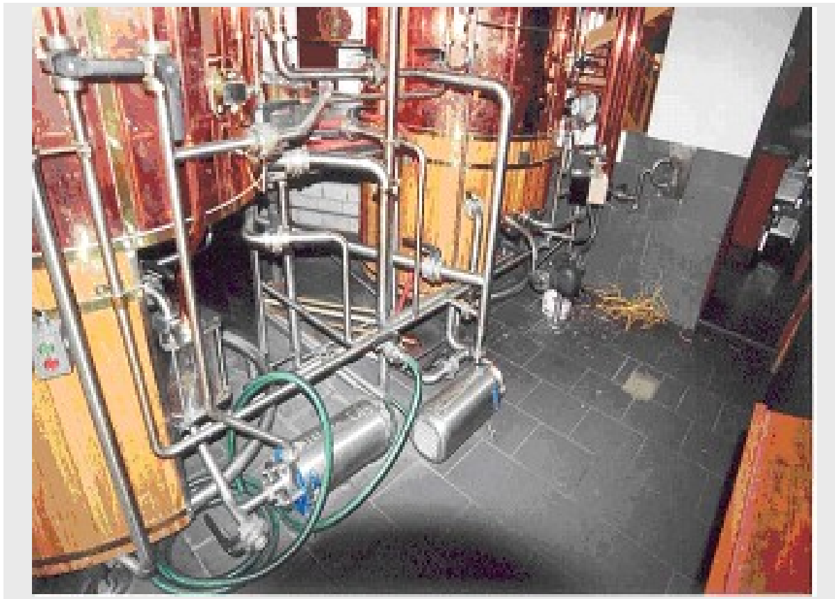
Sudhaus mit Maische- und Läuterpumpe