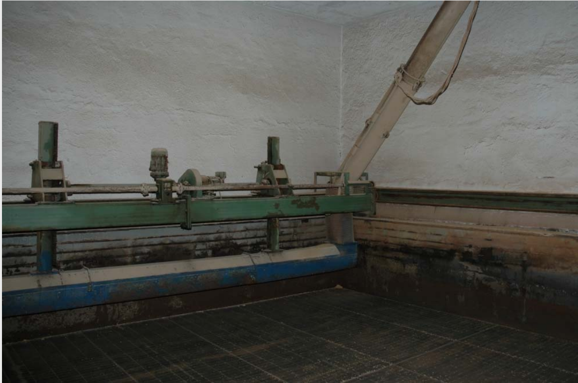
Загрузка зеленого солода