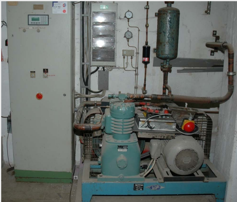
Холодильное оборудование для солодорасти́тельного ящика