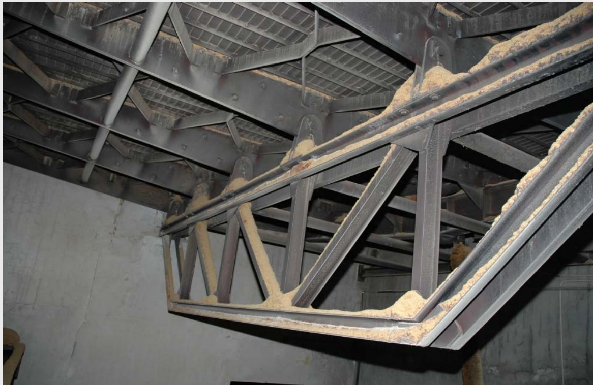
Опрокидываемые сушильные решетки