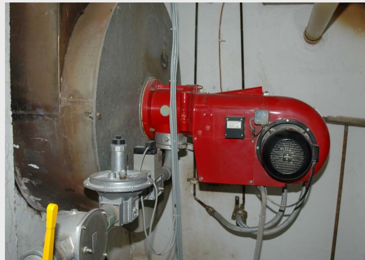
Нагрев с горелкой