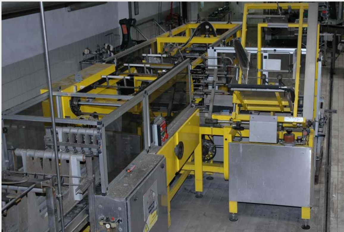
Упаковщик в картонные ящики