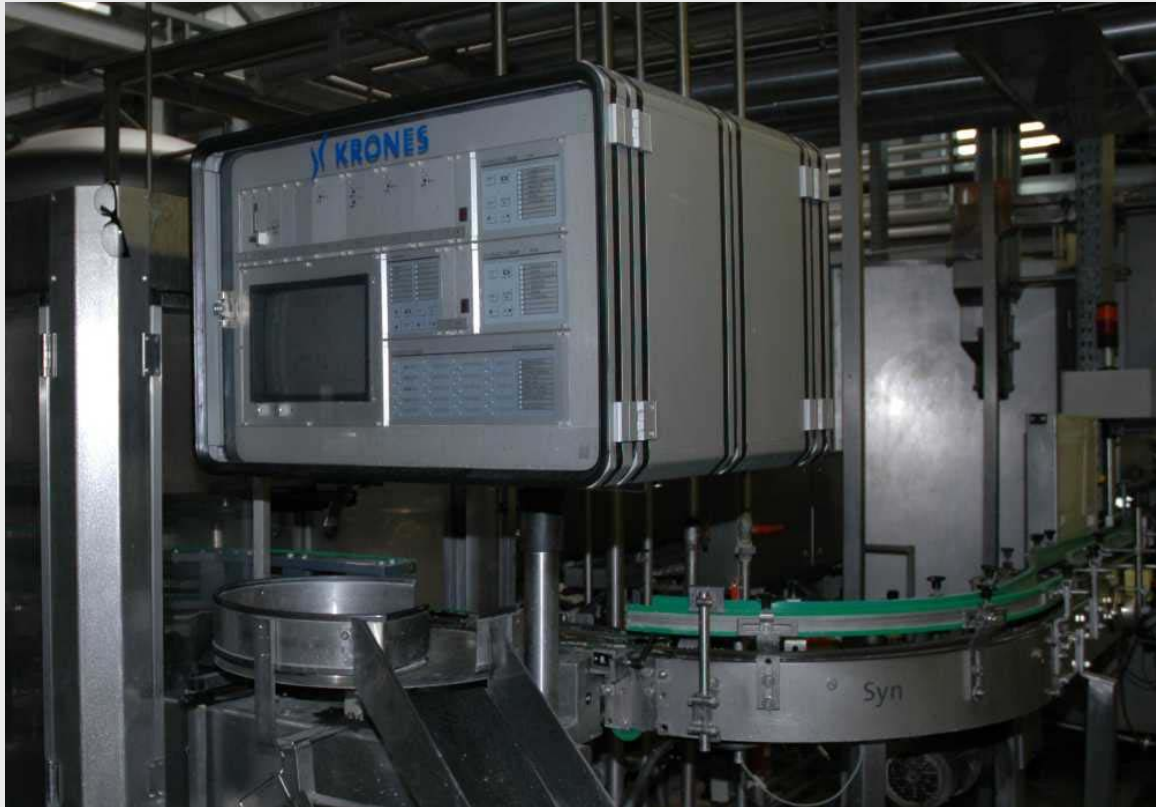
Контроллер пустых бутылок

Различные фотографии – линия розлива в бутылки 25.000 бут. в ч