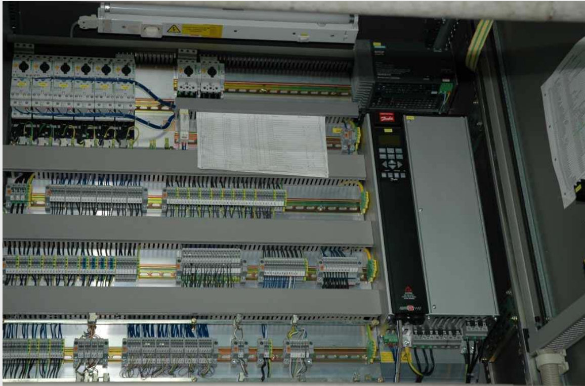
Бутылкомоечная машина – управление

Различные фотографии – линия розлива в бутылки 25.000 бут. в ч