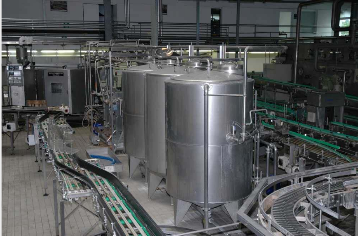
Общий вид линии и система очистки без демонтажа