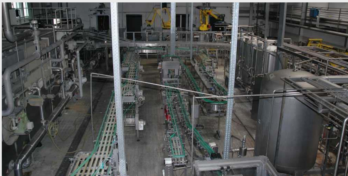
Общий вид линии розлива